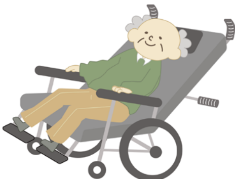
リクライニング車椅子